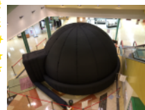
6mドーム（於：アスティア加西様）

惑星を手にとれるARシステム、「ぶらはんど」をあわせれば、学びの効果もアップ！ *「ぶらはんど」はオプションです。