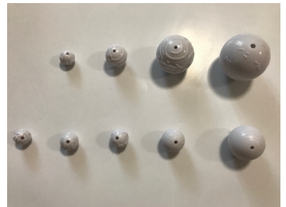
太陽と水星～海王星までの8惑星